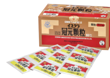
イスクラ冠元顆粒 第2類医薬品