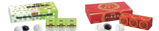
イスクラ杞菊地黄丸 第2類医薬品 イスクラ双料参茸丸 第2類医薬品