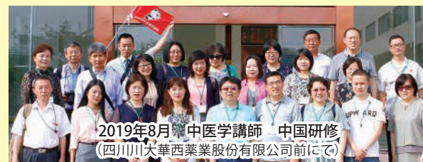
2019年8月 中医学講師 中国研修 (四川大華西薬業股份有限公司前にて)