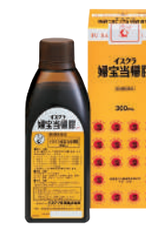
イスクラ婦宝当帰膠 第2類医薬品