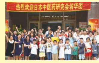
2019年ハルビン市平房区少年宮を訪問