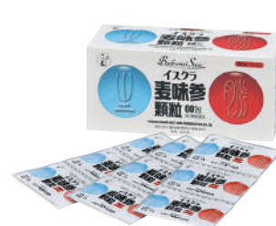
イスクラ麦味参顆粒 第3類医薬品