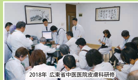
2018年 広東省中医医院皮膚科研修

研究会専売品を供給するイスクラ産業(株)には、中医学講師が多数在籍しており、これらの講師陣から直接学ぶことができます。また、中国の病院などで臨床を学ぶ機会も多数あります。